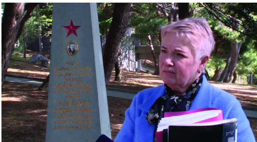
Представитель общественности Фороса с пачкой отписок чиновников

сделают шурф, куда и опустят останки. Вот так, заруют, как кота, зачихнут, сделав подкоп под могилу.