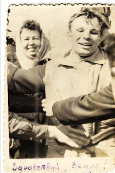
*1.2 Тот самый снимок и надписи на его обороте.

«РОДИНА» РАЗЫСКАЛА ЧЕЛОВЕКА, КОТОРЫЙ СДЕЛАЛ ПЕРВЫЙ ПОСЛЕ ПРИЗЕМЛЕНИЯ СНИМОК ЮРИЯ ГАГАРИНА