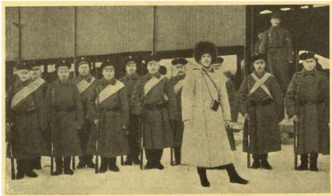
Сибиряки съ поезда спѣшать на передовыя позиціи.