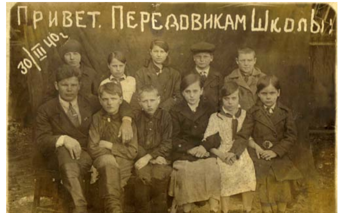
Дети и внуки переселенцев — ученики местной школы