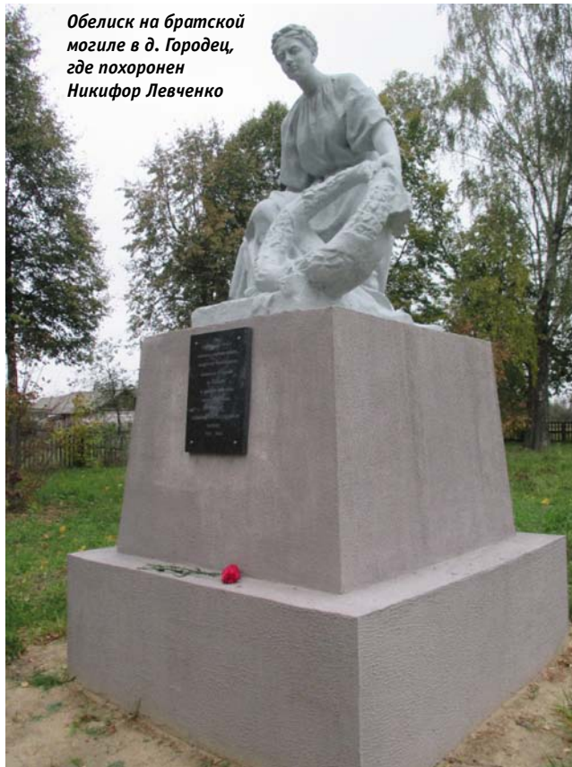
Обелиск на братской могиле в д. Городец, где похоронен Никифор Левченко