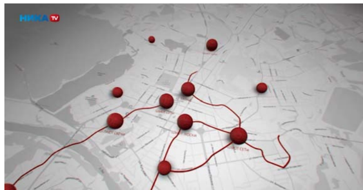
Графика из фильма