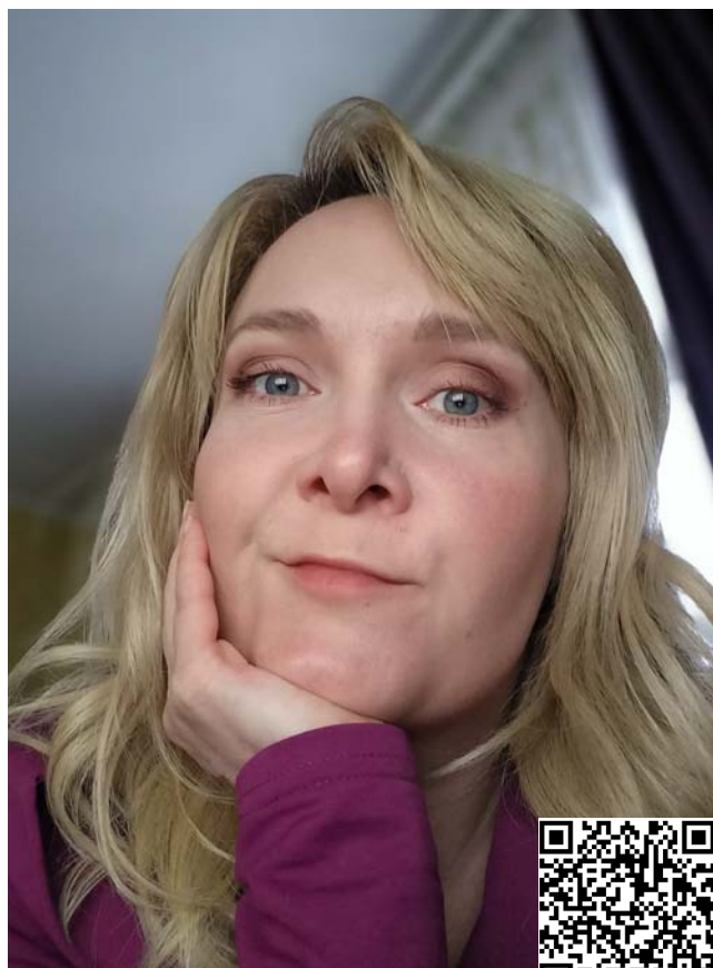
Смотреть фильм «Связанные»

Это был конец января 2023 года, тогда волонтерские организации только набирали обороты. Многие с иронией относились к тому, что пенсионерки