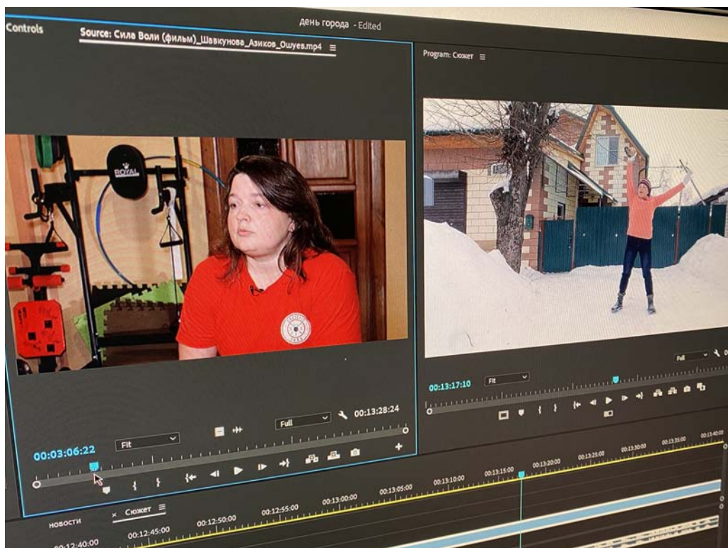
Монтаж фильма «Я сурдопереводчик»