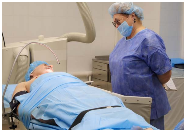
Операционная НИИ кардиологии

Я тогда работала в тесном содружестве с отделом по борьбе с организованной преступностью МВД, и парни мне очень помогли в расследовании. Более того, тогдашний томский губернатор — Виктор Кресс — обеспечил сопровождение в лице полковника полиции, профинансировав командировку в