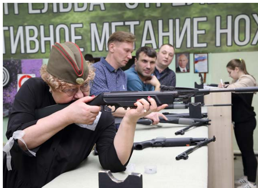
Соревнования томского Союза журналистов по стрельбе и метанию топоров

— Воспоминаний столько, что иногда задумываюсь — как за 40 лет возможно было стать вольной или невольной участницей такого количества совершенно разных, порой судьбоносных для страны событий? Легко! Правильно сделала, что послушала министра обороны СССР и получила диплом журналиста. Командировка в Комсомольский леспромхоз — а там тайга полыхает, и огонь вот-вот перекинется на поселок. Шашлык из дикобраза на одной из застав на таджикско-афганской границе и искренняя радость служивших там томичей от подарков из дома — черного хлеба, селедки и теплых свитеров. Ночное небо Байконура (остановились на дозаправку), которое, казалось, вот-вот рухнет на наш само-