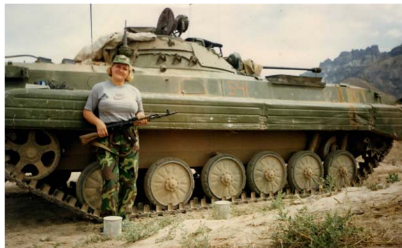
На учениях в 201 мотострелковой дивизии, таджико-афганская граница