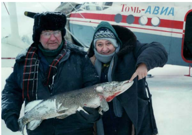
Всем уловам улов

никакого отношения к ликвидации аварии не имела, ее супруг — отдаленно. Опубликовала материал в областной газете. Против чиновницы было возбуждено уголовное дело, она получила реальный срок с конфискацией.