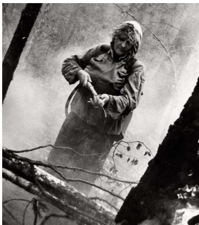
На тушении лесного пожара, угрожающего поселку

Так что пользу могу принести много где и при возможности делаю это с огромным удовольствием.