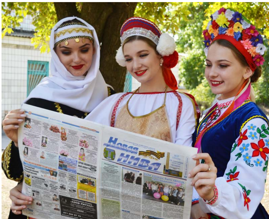
Сила газеты — в многонациональном единении

горело, оргтехника, мебель, машина исчезли бесследно.